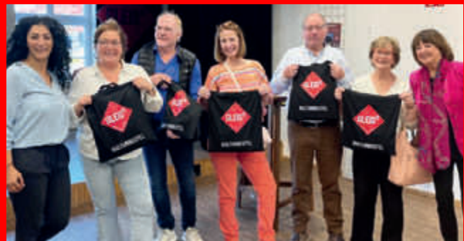
▲ Besucher aus Belgien schauten sich im Kulturbahnhof um.