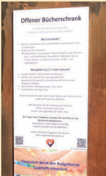
▲ Ein Schild weist auf die Nutzungsregeln hin.