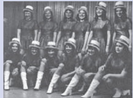
Vor vielen Jahren hatten die Fidelen 15 auch ein Damentanzcorps.

pen. Aktuell zählen die Fidelen 105 Mitglieder in verschiedenen Gruppen, darunter Blauröcke, Kanoniere, Damen und Erftmariechen. Die Tanzgruppe ist das Aushängeschild des Vereins und wurde 2016 gegründet. Mittlerweile sind hier 34 Tänzerinnen und Tänzer zwischen sechs und 23 Jahren aktiv. Einmalig ist auch die Wagenbauhalle des Vereins in einem alten Gebäude der Glashütte am Sonnenhang. „Da haben wir fünf Wagen aus den 30er und 40er Jahren, die wir mit viel Engagement Instand halten“, erzählt der Vereinsvorsitzende. Ge- feiert werden soll der runde Geburtstag übrigens während der gesamten Session. Zum Frühschoppen im Bürgerhaus am Sonntag, 23. Februar, 11.11 Uhr sind alle Jecken herzlich eingeladen. Nähere Infos zu allen Terminen unter www.kg-fidele-15.de oder auf Facebook.