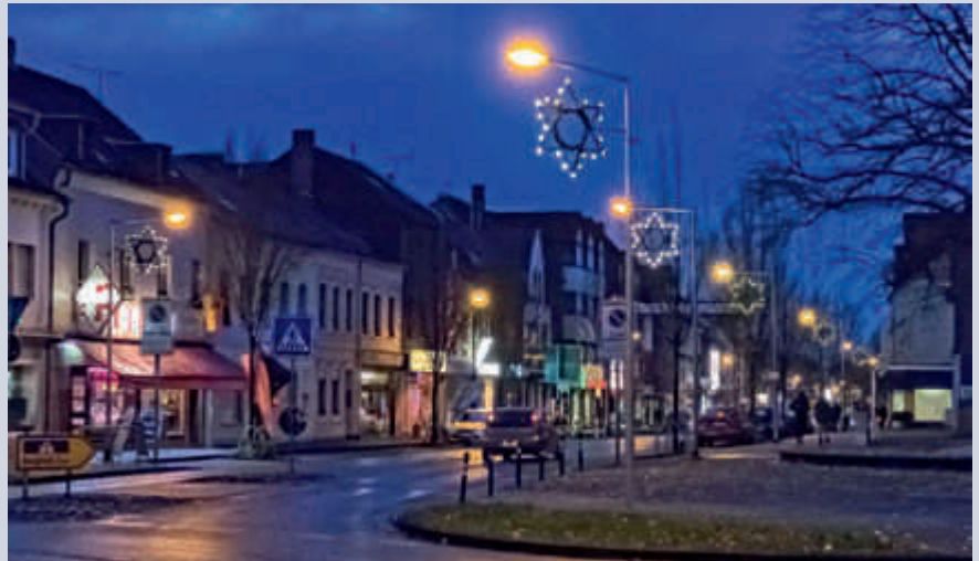
▲ Nicht billig ist die festliche Weihnachtsbeleuchtung für die Ort.

Nun funkeln sie wieder. Die Weihnachtssterne an den Straßenlaternen. Von 17 bis 22 Uhr sorgen zahlreiche LED-Lämpchen auf der Köln-Aachener-Straße und in der Priamosstraße für gemütliche Stimmung. Viele Jahre hat sich der Handel-, Handwerk- und Gewerbeverein Quadrath-Ichendorf e.V. (HHG) darum gekümmert. Um die Weihnachtsbeleuchtung für unseren Ortsteil zu erhalten, hat der Verein Mein Quadrath-Ichendorf e.V. (MQI) die Weihnachtsbeleuchtung übernommen und kümmert sich um die Organisation des Auf- und Abhängens sowie die Instandsetzung. Das alles verursacht Kosten, die der Verein ohne Spenden nicht aufbringen kann. Wir würden uns sehr freuen, wenn Sie uns mit einer Geldspende unterstützen. So bringen wir gemeinsam eine weihnachtliche Stimmung in unseren Ort. Sie können für ihren Beitrag eine