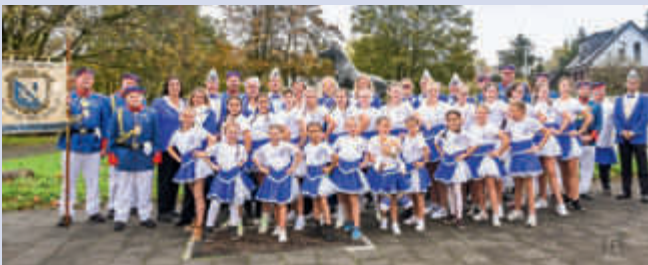
▲ Die Erftmariechen sind während der Session auf vielen Bühnen zu Gast.