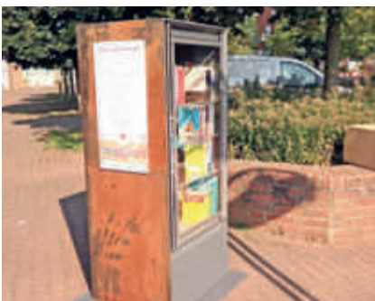
Lesen unterm Straßenbaum Zweiter Bücherschrank an der Priamos- straße S. 4