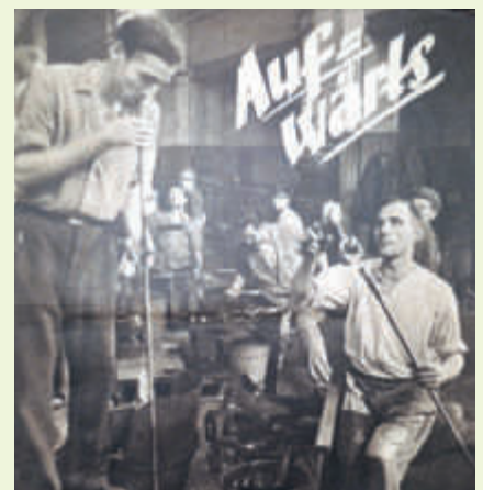
▲ Über die Arbeit in der Glashütte berichtete 1948 die Gewerkschaftszeitung „Aufwärts“. Wenn sie auch noch alte Fotos haben, melden sie sich.

zwischen 1944 und 1946 einen wichtigen Beitrag leisten können. In Zusammenarbeit mit dem Projektkurs „Zeitzeugen“ der Gesamtschule Bergheim sollen ergänzend auch die individuellen Erfahrungen festgehalten werden. Für schriftliche oder fotografische Quellen nehmen Sie bitte Kontakt mit Lena Delbach (Stadtarchivarin) unter 02271/89 211 oder lena.delbach@bergheim.de auf, für die Zeitzeugen melden Sie sich bei Elisabeth Amling (Gesamtschule Bergheim) unter 02271/79 96 915 oder unter amling@gesamtschule-bergheim.de . bb