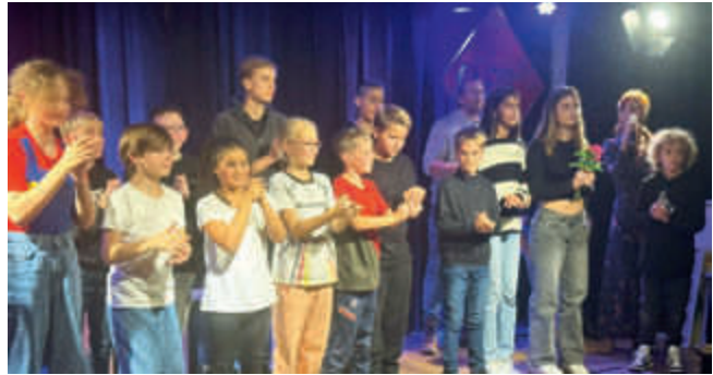
▲ Nach ihren Auftritten ließen sich die Jugendlichen auf der Bühne feiern.