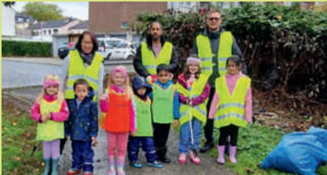
▲ Jede Menge Abfall sammelten auch die Kinder in Grünanlagen und am Straßenrand.